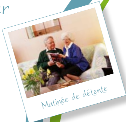
Matinée de détente

La résidence, située au cœur de Saint-Philibert, offre la proximité de la bibliothèque, de la médiathèque, du marché, de la mairie, de la supérette... Ce petit village de caractère allie services, commodités et environnement préservé. A deux pas de la mer et de la beauté des paysages du Golfe, ce cadre privilégié offre un havre paisible et de multiples balades.