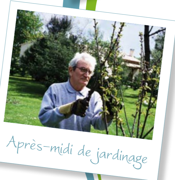
Après-midi de jardinage